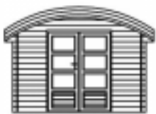
FIRENZE 300 D

Bois : sapin rouge du Nord traité autoclave Epaisseur parois : 28 mm, montage par emboîtement Plancher de sol : planches prémontées 16 mm, traitées autoclave Dimensions extérieures mur : - Façade : 3,00 m - Profondeur : 2,50 m - Hauteur faîtage : 2,47 m - Hauteur des murs : 2,01 m Menuiserie : - 1 double porte vitrée 3V 140 x 188 cm 2V - 1 fenêtre fixe 121 x 56 cm - quincaillerie couleur noir Toit : galbé Couverture de toit : - tôles acier galbées brun-rouge - coolgreen Gouttière : PVC, diam. 12 cm, + descente Coloris gris clair Planche de rive : galbée devant et derrière Avancee de toit : - 94 cm à l'avant - 30 cm sur les cotés - 15 cm à l'arrière